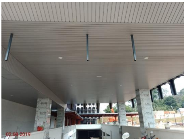
Ramp to basement