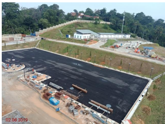
Tempat Letak Kereta