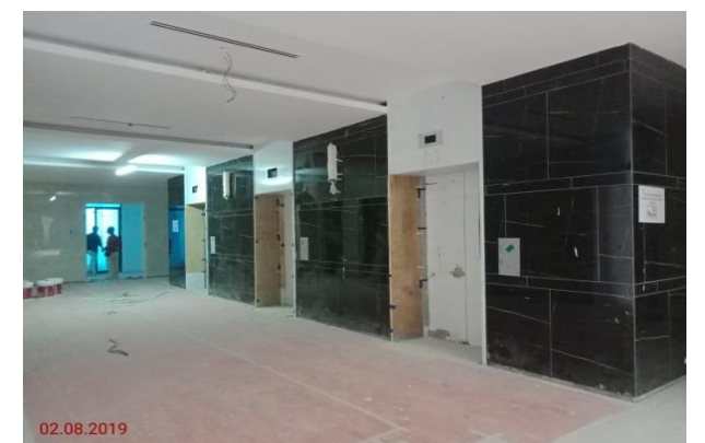
Aras 4 – Lobby Lift