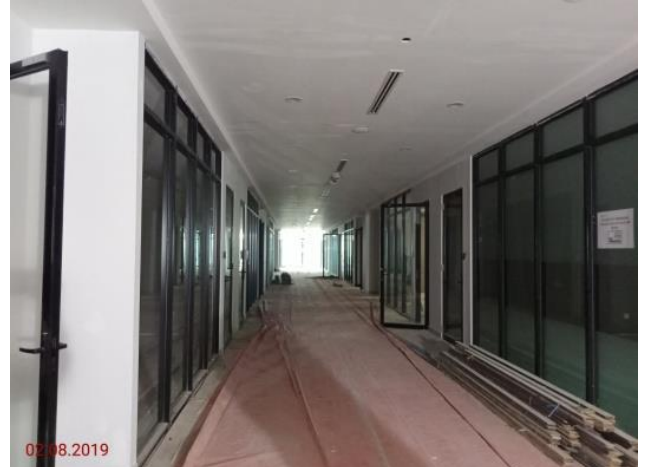
Aras 3 – Koridor