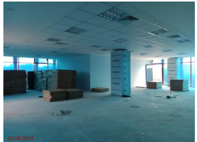
Aras 4 – Ruang pejabat