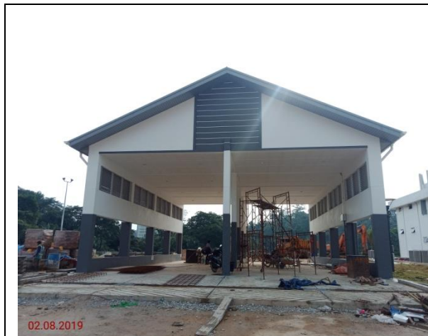
Tempat Letak Bas Berbumbung