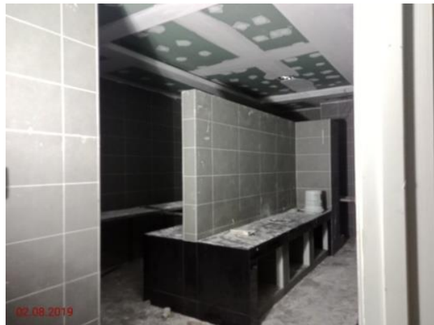
Aras 4 – Tandas