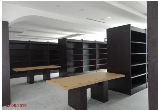
Aras Tanah - Perpustakaan