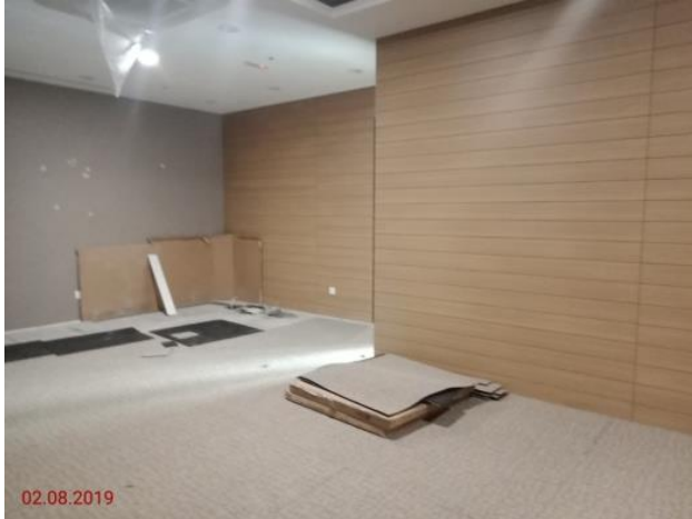
Aras 3 – Bilik Kementerian