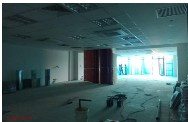
Aras 4 – Bilik Latihan