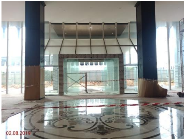
Aras Tanah – Pintu Masuk Utama