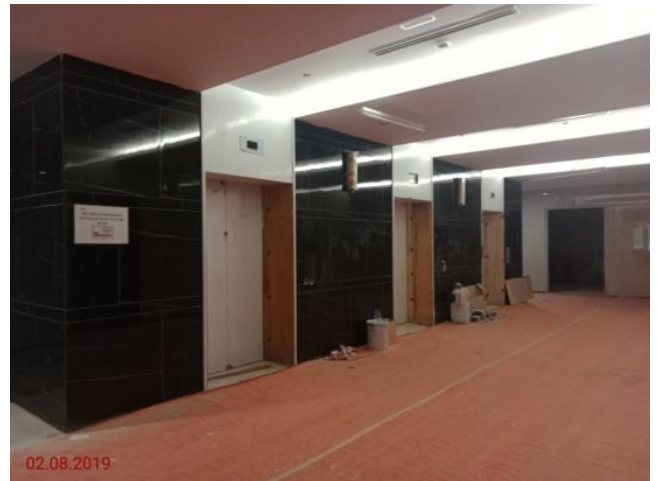
Aras Tanah – Lobby lift