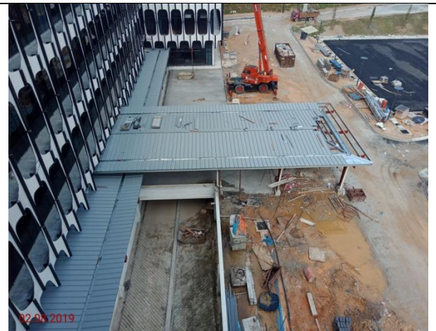
Covered Walkway Blok MP