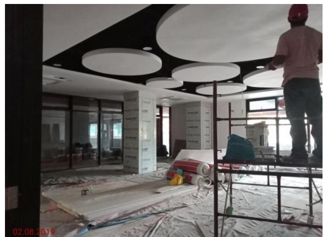
Aras Tanah – Kafetaria