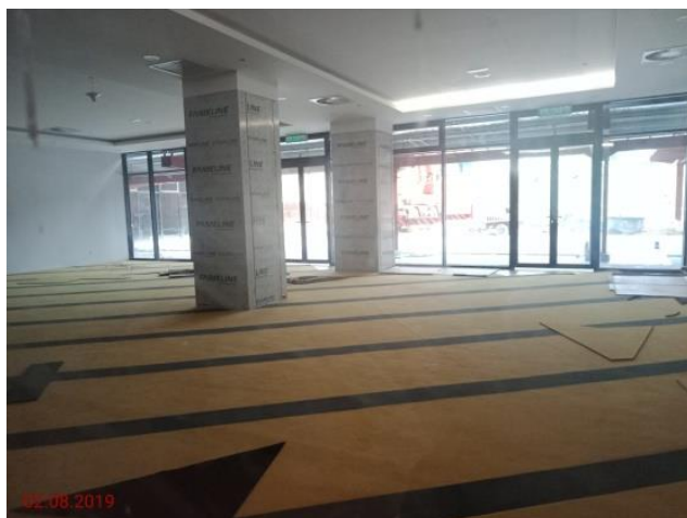
Aras Tanah – Surau