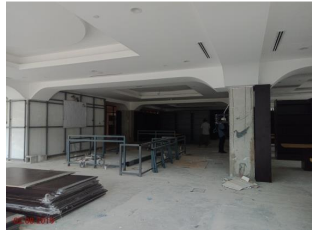
Aras Tanah – Kaunter Perpustakaan