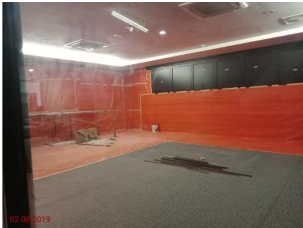
Aras Tanah – Bilik Jamuan