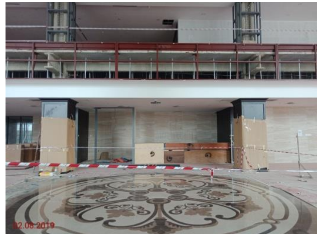
Kaunter Hadapan – Lobi Utama