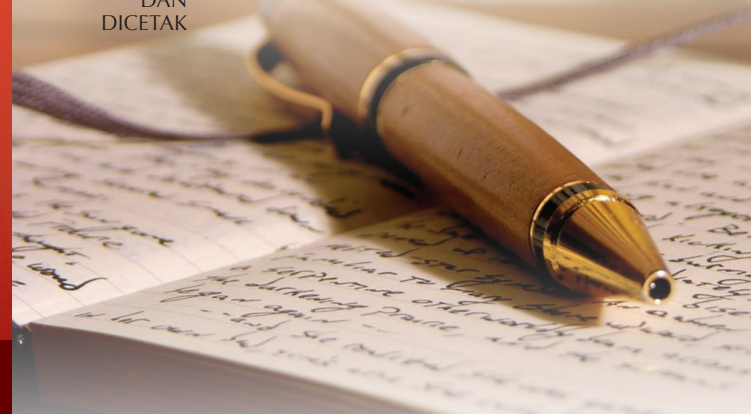
Gambar muka depan

REKABENTUK DAN DICETAK Percetakan Watan Sdn. Bhd.