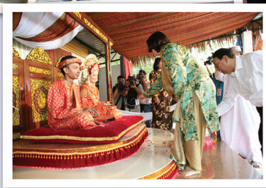
■ Delegasi CPA melawat negeri bersejarah, Melaka.