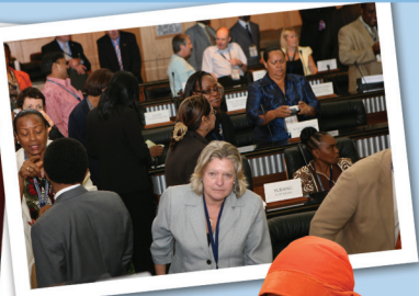
■ Pertemuan Setiausaha-setiausaha Dewan Anggota CPA dan lawatan delegasi CPA ke bangunan Parlimen Malaysia