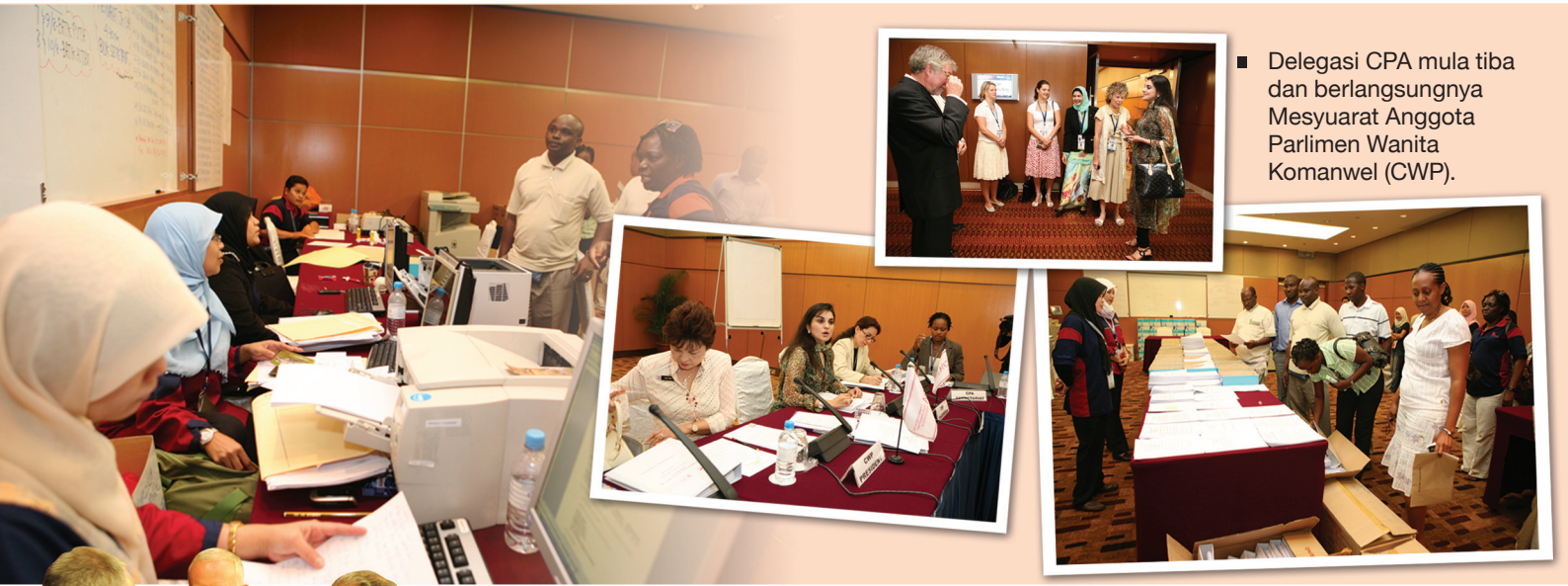
■ Delegasi CPA mula tiba dan berlangsungnya Mesyuarat Anggota Parlimen Wanita Komanwel (CWP).

Sepanjang 10 hari di Persidangan Parlimen Komanwel ke-54 pelbagai isu dibangkitkan termasuk soal krisis makanan dunia, keselamatan, alam sekitar dan langkah-langkah membasmi kemiskinan sejagat.