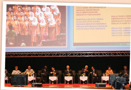
■ Perasmian Persidangan Parlimen Komanwel ke-54 oleh Timbalan Perdana Menteri, Y.A.B. Dato' Sri Mohd Najib Tun Abdul Razak