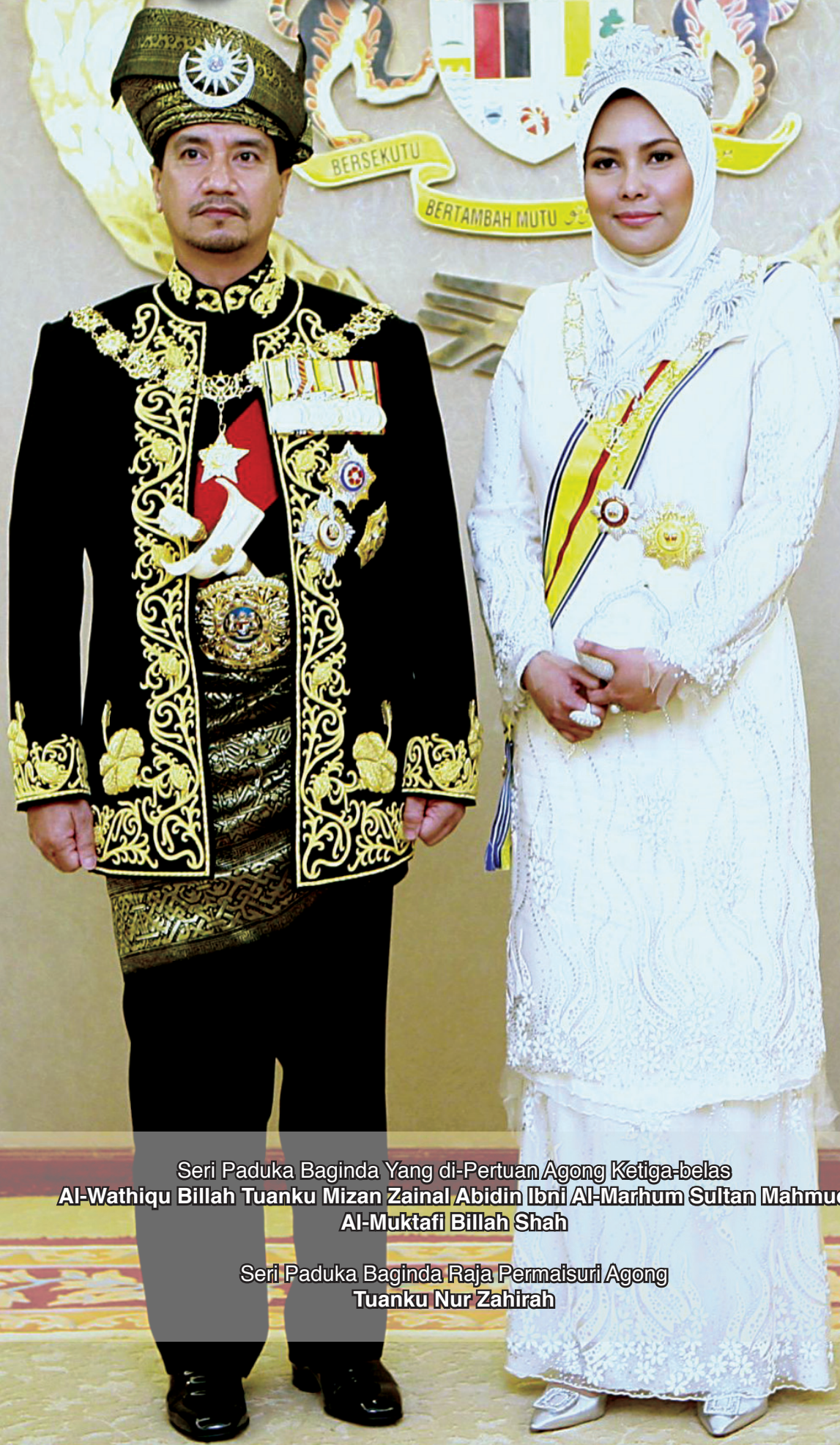
Seri Paduka Baginda Yang di-Pertuan Agong Ketiga-belas Al-Wathiqu Billah Tuanku Mizan Zainal Abidin Ibni Al-Marhum Sultan Mahmud Al-Muktafi Billah Shah