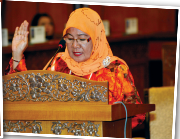
Senator Puan Hajah Noriah Binti Mahat