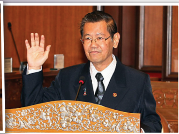
Senator Tuan Khoo Soo Seang