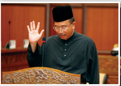
Senator Dato' Mohammed Najeeb Bin Abdullah