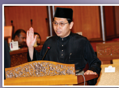
Senator Tuan Mohamad Ezam Bin Mohd Nor