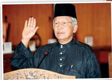
Senator Dato' Abdul Rahim Bin Abdul Rahman