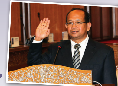
Senator Tuan Boon Som A/L Inong