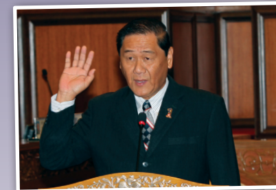
Senator Tuan Pau Chiong Ung