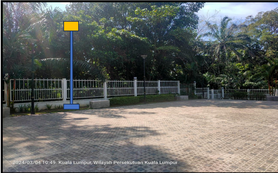
CADANGAN TAPAK LAMPU LIMPAH MENGGUNAKAN KABEL COMPOUND LIGHTING