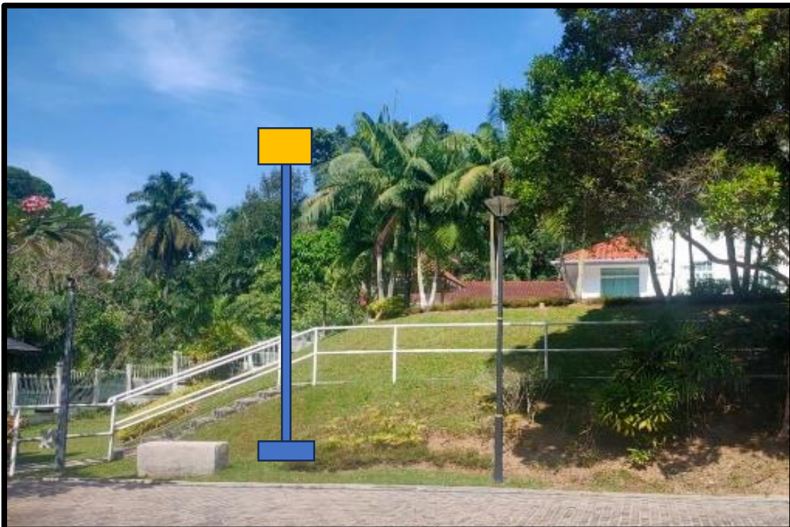
CADANGAN KEDUDUKAN LAMPU LIMPAH SOLAR DI LAMAN RIADAH RUMAH YPDN